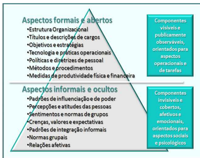
Figura 1 Aspectos Formais e Informais da cultura organizacional

Para Chiavenato (2004) certos aspectos da cultura organizacional são facilmente percebidos enquanto outros são mais ocultos e de diferente percepção assim como um iceberg , ficando os aspectos formais como as políticas e diretrizes, os métodos e procedimentos, objetivos, estrutura organizacional e tecnologia adotada na parte visível. Os aspectos informais que envolvem percepções, sentimentos, atitudes, valores, interações informais e normas grupais, que são de mais difícil compreensão, na parte inferior do iceberg .