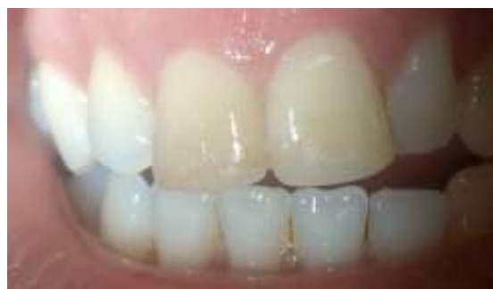
Figura 1: Aspecto intrabucal inicial.

No exame radiográfico periapical, o elemento 11 apresenta lesão radiolúcida bem delimitada circundando o ápice, com diâmetro de aproximadamente 15 mm, ápice radicular aberto e canal radicular extremamente amplo.