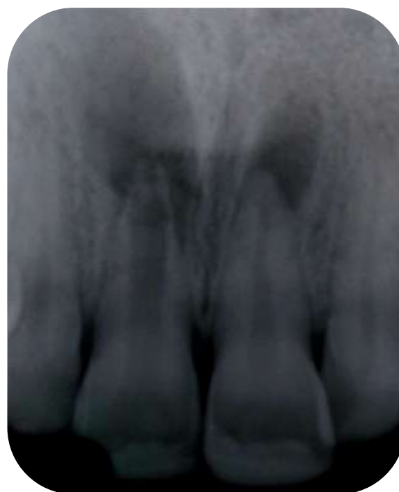
Figura 2: Radiografia inicial.

No exame radiográfico periapical, o elemento 11 apresenta lesão radiolúcida bem delimitada circundando o ápice, com diâmetro de aproximadamente 15 mm, ápice radicular aberto e canal radicular extremamente amplo.