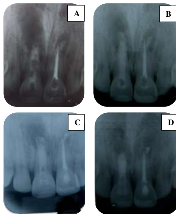
Figura 4: A - Primeira aplicação da pasta de Hidróxido de Cálcio Ultracal ® Xs. B – Segunda aplicação C – Terceira aplicação D – Sete meses após a terceira aplicação

No entanto, em razão do forame apical, apresentar-se extremamente amplo, optou-se pelo tamponamento apical com MTA.