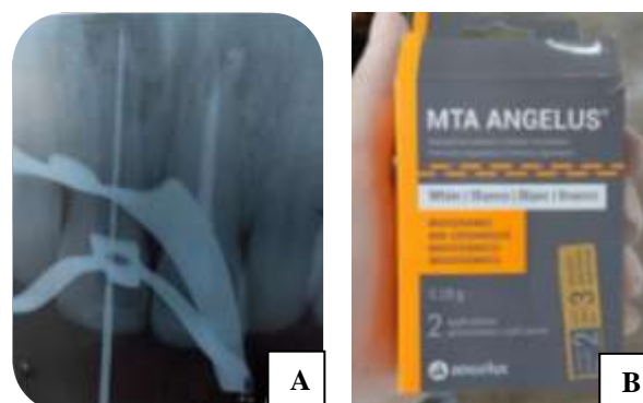
Figura 5: A - Odontometria para aplicação de MTA. CPC: 20mm B – Agregado Trióxido Mineral Angelus ®

No entanto, em razão do forame apical, apresentar-se extremamente amplo, optou-se pelo tamponamento apical com MTA.